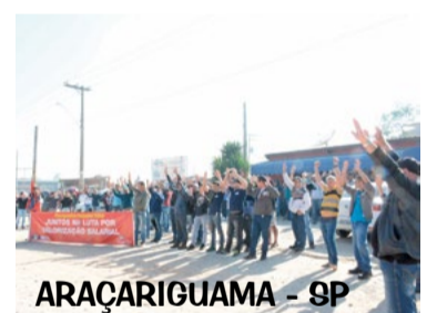
ARAÇATIGUAMA - SP