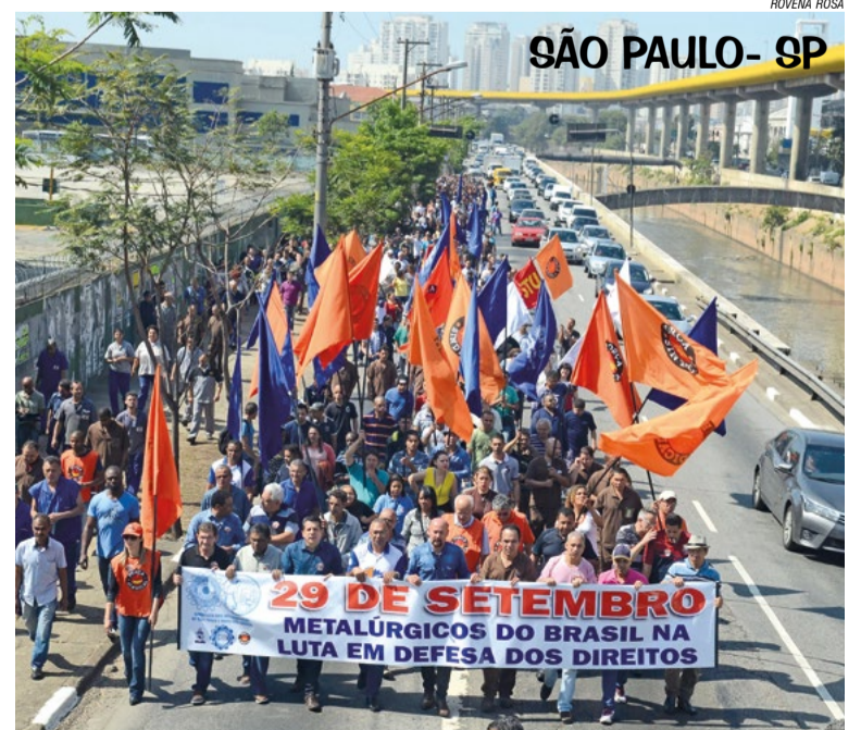
SÃO PAULO - SP