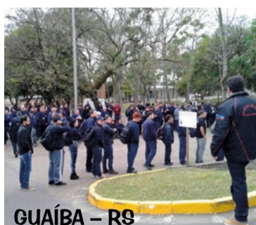
GUAÍBA - RS