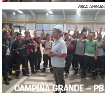
CAMPINA GRANDE - PB