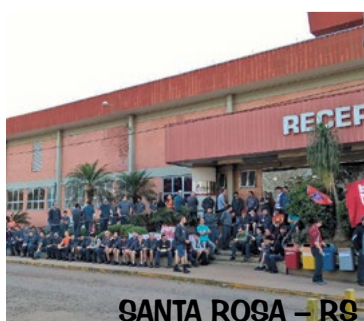
SANTA ROSA - RS