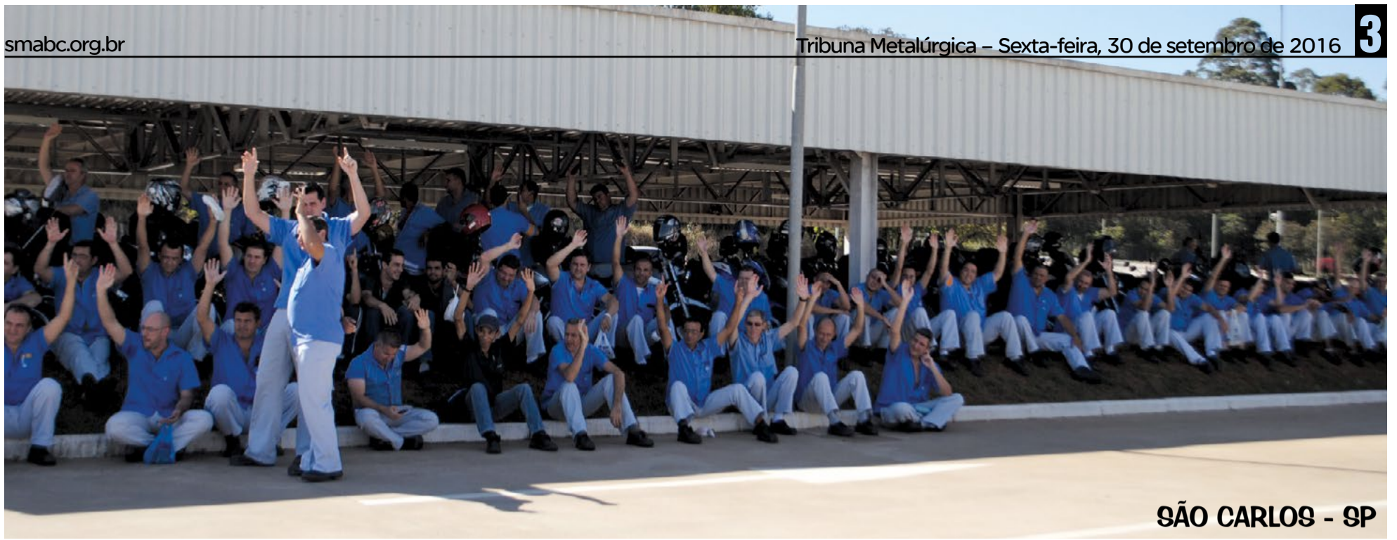
SÃO CARLOS - SP