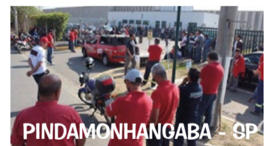
PINDAMONHANGABA - SP