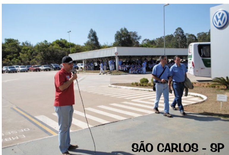
SÃO CARLOS - SP